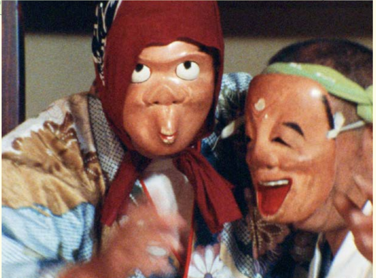
ふるさとあさおシリーズより①,②,③『石仏は語る』④,⑤『時を越えて 麻生に伝わる郷土芸能』