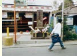
『石仏は語る』 (1997年ごろ/27分/16ミリフィルム)

黒川・早野・下麻生などに伝わる念仏講を取り上げた映像。人々が集い念仏を唱える様子から、信仰が暮らしに根付いていたことがうかがえます。