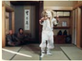
『時を越えて 麻生に伝わる郷土芸能』 (1992年/23分/16ミリフィルム)

黒川・早野・下麻生などに伝わる念仏講を取り上げた映像。人々が集い念仏を唱える様子から、信仰が暮らしに根付いていたことがうかがえます。