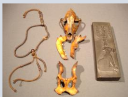
修験者が祈祷に使ったとされるオオカミの頭骨ほか三点セット