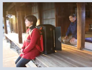
巡り地藏 <宮前区・高津区>