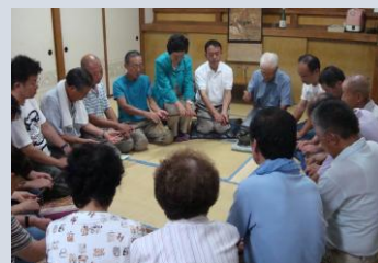
円座する念仏講 <宮前区初山>