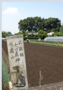
畑を見守るオオカミの護符

それは、「人間だけが集うようになった都市的な世界」に古くて新しい価値を問いかけ、いつの間にか映像を見る人をも温かな世界へと誘う。