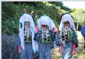
三匹獅子舞<宮前区初山>