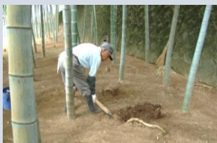
タケノコ根埋け<宮前区土橋>