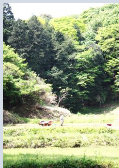
多摩丘陵の谷戸<麻生区黒川>