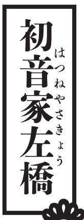
はつね かず きよ ゆう 初音家左橋

江戸～昭和時代にかけて作られた演目を古典落語と呼ぶのに対し、新作落語は戦後に作られた演目。現代の感覚にもとづいて作られているため、分りやすく、親しみやすいのが特徴です。