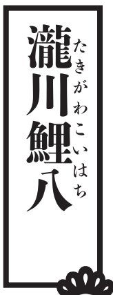
たきがわ えい はち 瀧川鯉八