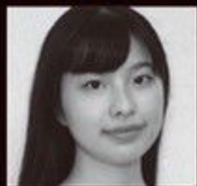
A いつノ まな