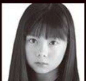
ラヴィンニュ美雲 (フリーウェーブ)