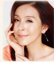
黒猫シュシュ/ 杉本 彩 (4/2)