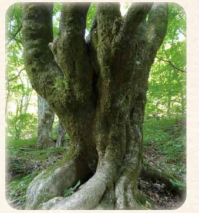
木の声/ 金田有希 (声の出演)