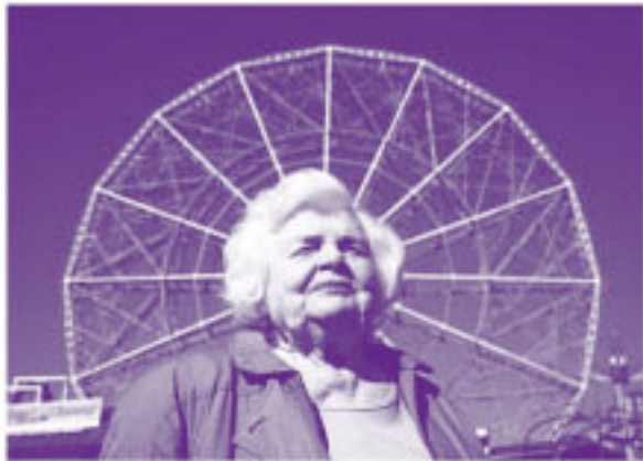
© 2025 CLANCY MURPHY FILM, LLC AND TRISHA PRODUCTIONS, INC. ALL RIGHTS RESERVED