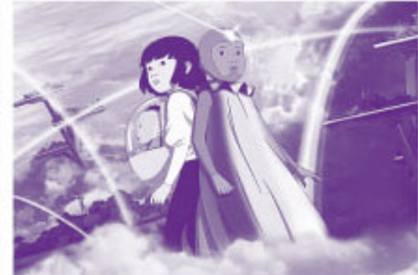
© 2025 November / month6 / France 3 CINEMA