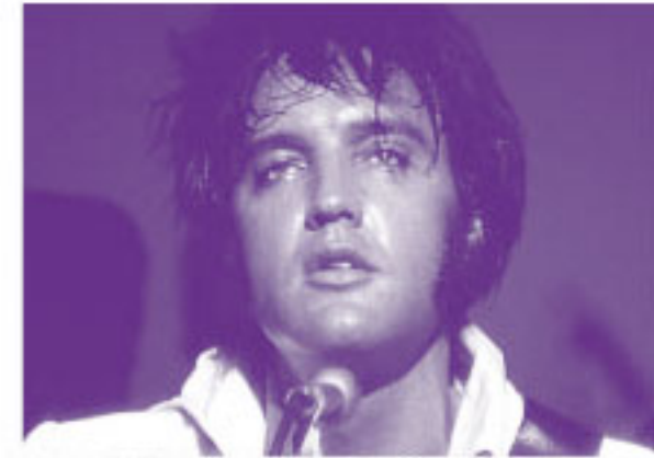
© 2025 SONY MUSIC ENTERTAINMENT. ALL RIGHTS RESERVED.

2025年 | オーストラリア | カラー | ビスタ | 1h37 | DCP