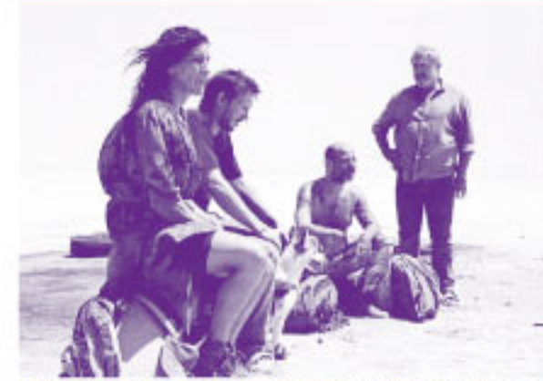
© 2025 LOS HEREDEROS FERRAZ, S.L. & TELERINCA AUDIOVISUAL DIGITAL, S.L.L. FILMES DA ERINCA, S.L. & OCEBO DA, S.L.L. LRI FILMS, S.L. & AM PRODUCTIONS

2025年 | スペイン、フランス | カラー | ビスタ | 1h55 | DCP | PG12