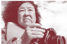
「オキナワより愛を込めて」 ery elephant film - 3c. use © 2023